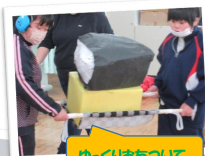
ゆっくりおちついて

6年生が卒業式の練習をしている時間を使い、1年生から5年生までクラスをまたぎ、準備や練習を重ねてきました。司会、始めの言葉、終わりの言葉を3組が担当しました。ゲームは卒業生とペアになって大型のおかずを運び、大きなお弁当箱を完成しました。最後に2組のみんながメッセージの旗を立ててくれました。また図工の授業で作ったコルクボードを6年生にプレゼントしました。手渡されると嬉しそうに写真を眺めていました！6年生は一人ずつ中学部でがんばることを発表し、最後にみんなの大好きなプレイバルーンも楽しみました。