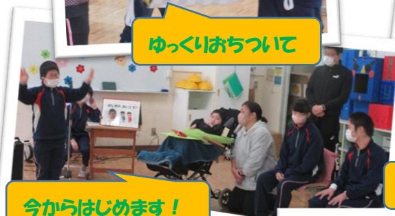
今からはじめます！